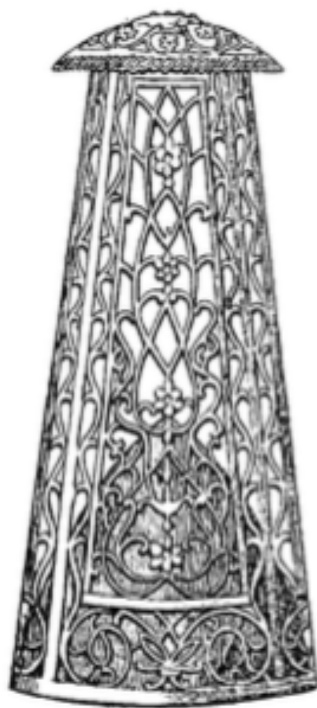
Sarmah portée par des fillettes.

Depuis une quarantaine d'années cet ornement de la toilette des femmes a cessé d'être porté. La sarma n'est plus qu'un objet de collection en Algérie, mais elle est encore en usage en Syrie où elle porte le nom de tantour .