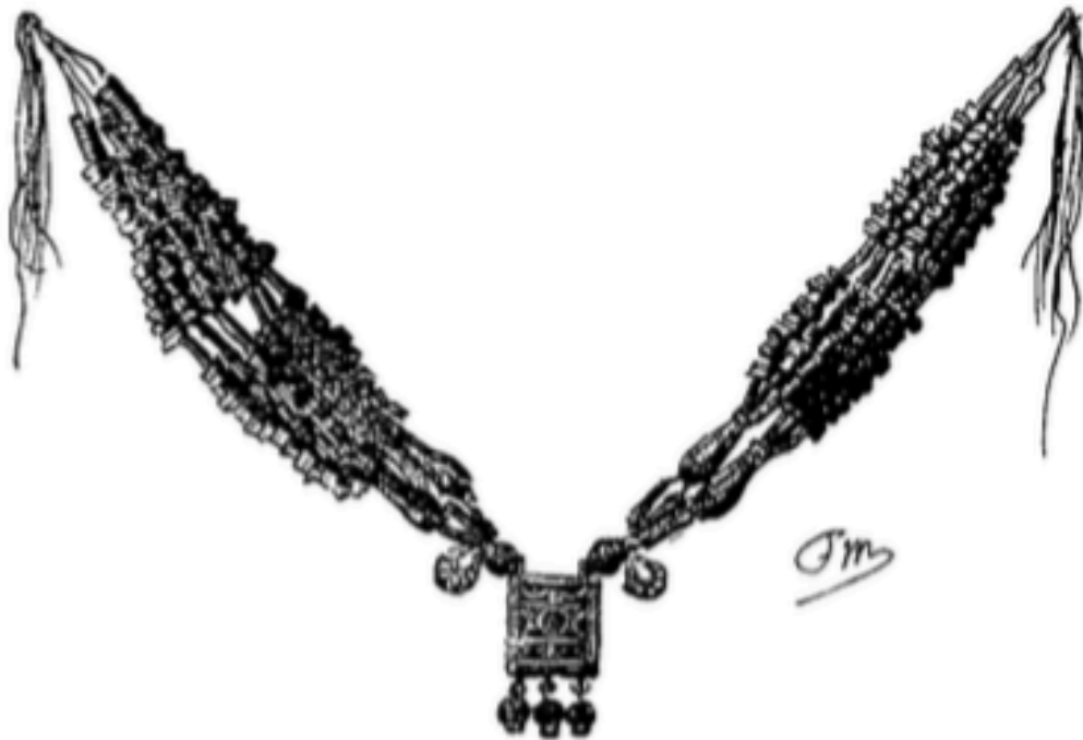
Tazlegt n' sekhab.

avec des graines connues sous le nom de El-Kemha . Le tout est pétri avec les doigts et reçoit une forme triangulaire. Ces morceaux réunis ensuite par la salive sont au nombre de cinq ou six ensemble pour former l'un des grains du collier odorant. Seules les femmes mariées peuvent porter le tazlegt n' sekhab qui dégage une forte odeur. Sous le nom de mekhang , M. Delphin désigne