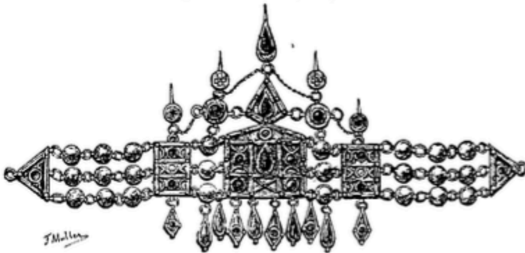
Ta'sabt des Beni-Yenni.

C E diadème kabyle plus grand que le zérir couvre le front. Le ta'sabt , ou ta'ssabt forme berbère d'açaba, est composé d'une plaque centrale, émaillée à l'envers et à l'avant, garnie de cabochons de corail et divisée en deux parties : l'une, rectangulaire, surmontée d'un fronton ; l'autre est un véritable losange. A la plaque centrale viennent