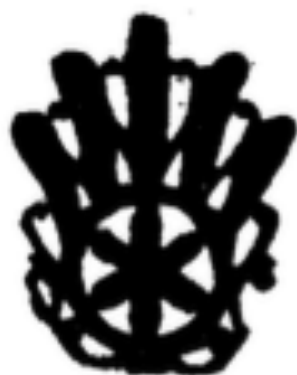
Qaleb pour klamsa.