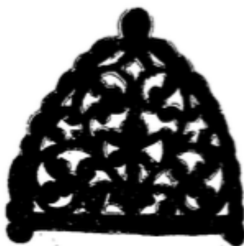
Qaleb pour Bzima.