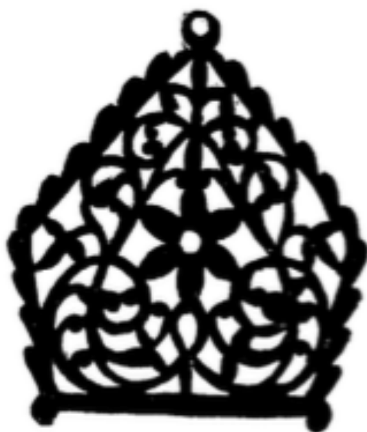
Qaleb (Modèle en cuivre pour fondre les anciens bzaim de Teniet el Had).