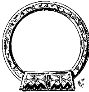
Khelkhâl menfoukh de Tunis.

COMME son épithète l'indique, menfoukh signifiant « gonflé », cet anneau de pied de Tunis est creux. Il affecte la forme d'un étrier.