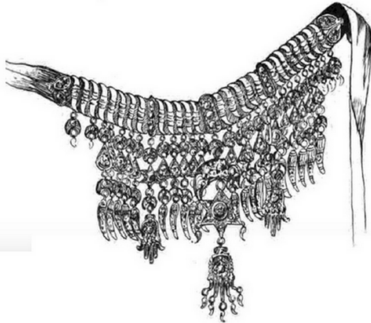
Chaïria de Tripoli.

A Tripoli, collier sur ruban avec garniture à plusieurs rangées de pendentifs. Ainsi appelé à cause de ses ornements qui ressemblent vaguement à des grains d'orge ( chaïra ). Au centre pend un grand croissant au milieu duquel est suspendue une étoile portant à son tour une sorte de Khamsa. Chacun des doigts de cette dernière reçoit encore une petite breloque. De chaque côté du croissant on remarque une autre khamsa plus simple. — Le mot chaïria est également usité à Djerba pour désigner un collier avec breloques en forme de grains d'orge et