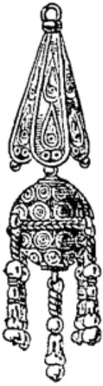
Lendjassa de Malte.

ques s'en parent encore, mais les juives ont totalement délaissé ce bijou. Très souvent, à ce collier pend, comme