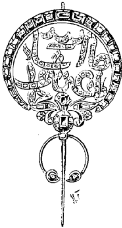
Bzima portant en caractères ajourés et en pierreries : Ce que Dieu veut. Travail d'origine douteuse.

fleurs, desmar- Bzima (En or, très ancienne). guer- tes, des trèfles, des volutes, des palmes. D'une monture très lé- gère, tout le travail des bzàim est fait à la main. La dimension de ces broches varie beaucoup; à côté de très grandes, il y en a de très pe- tites. Quand elles sont petites et allongées, on les nomme ferigate . Celles de Malte sont formées par une baguette d'argent tordue en cercle et recouverte ensuite de fil de même métal. La bzima rempla- çant l'épingle, inconnue des fem- mes arabes, est un objet de pre- mière nécessité. Le pluriel arabe