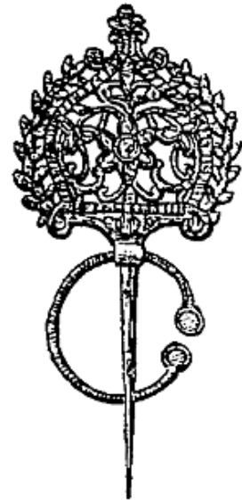
Bzâim deheb (Alger) (Épingle en or fabriquée pour les Européens).

A Oran, c'est le nom d'une broche de forme triangulaire, le plus souvent en argent, rarement en or à cause de son épaisseur. Ce bijou est percé d'une série de trous formant dessins. Une